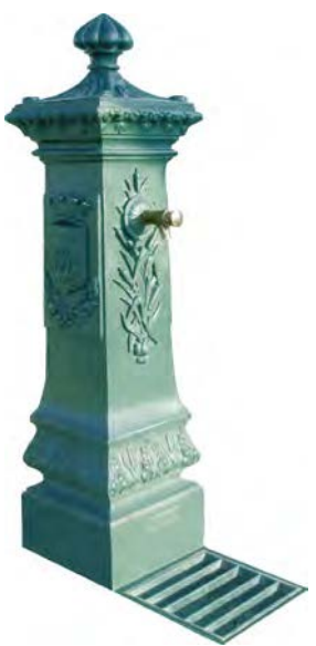
VILLE DE PARIS fontaine en fonte

Version 1 : Grille Carrée hauteur 1320 mm profondeur 610 mm largeur 310 mm