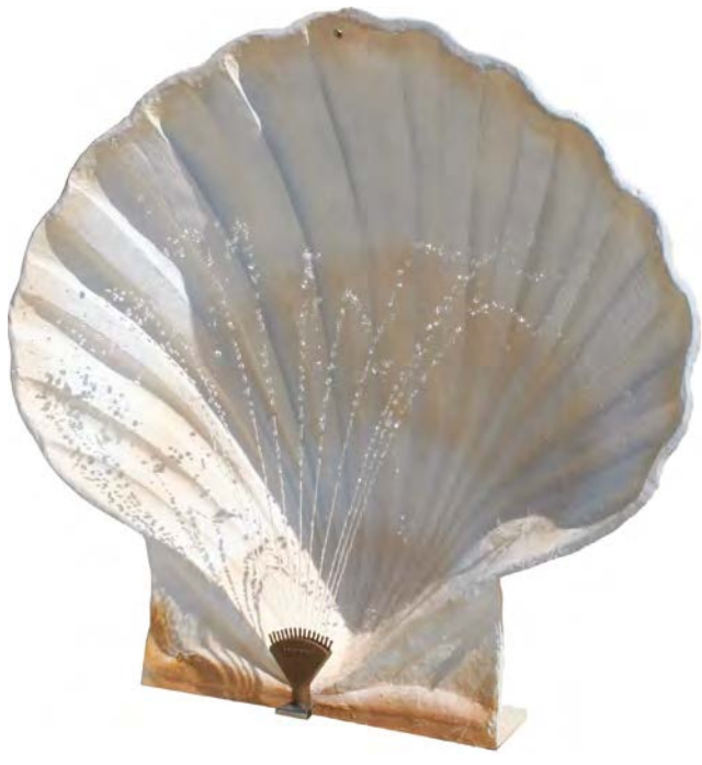
SAINT-JACQUES fontaine en fonte