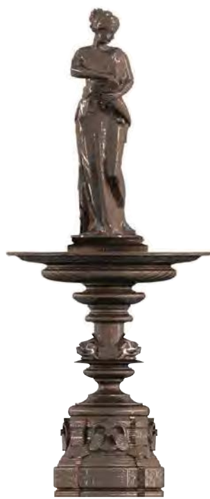
ARGENCE 1 fontaine en fonte

Bassin préconisé 4500. hauteur 3800 mm diamètre 1460 mm