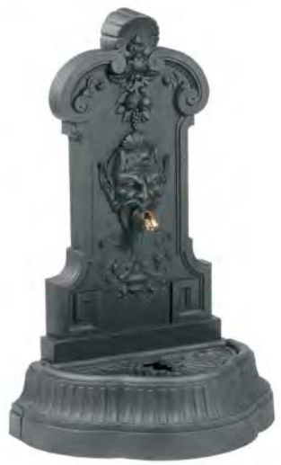
MEPHISTO fontaine en fonte

hauteur 1385 mm largeur 900 mm profondeur 570 mm