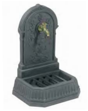
FLORALE fontaine en fonte

hauteur 870 mm profondeur 450 mm largeur 575 mm